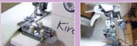
Sømguide og stærkt LED lys