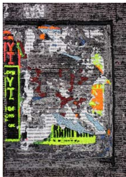
Machine embroidered examples