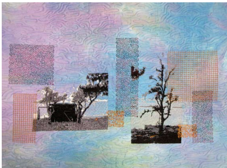
Machine quilted and then embroidered